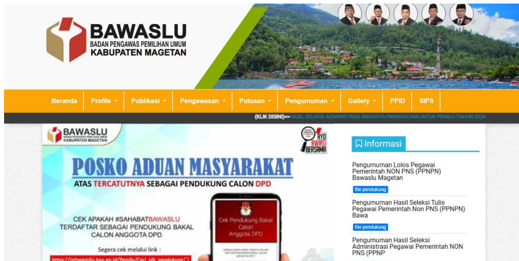
Gambar 9. Tampilan Website Utama Bawaslu Kab. Magetan