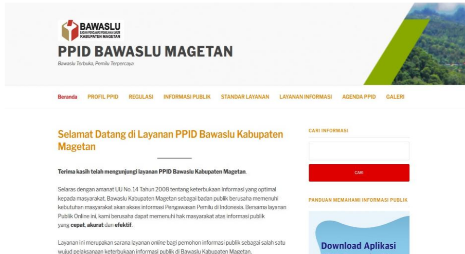
Gambar 5. Website PPID Bawaslu Kab. Magetan

Selain untuk menyajikan informasi publik, sejak tahun 2020 PPID Bawaslu Kabupaten Magetan juga merilis layanan permintaan informasi secara online menggunakan website.