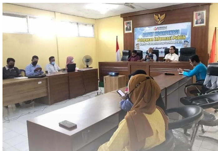
Gambar 2. Program PPID Bawaslu Kab. Magetan

Program kegiatan PPID di Kabupaten Magetan yang diagendakan pada tahun 2022 adalah pelayanan Informasi Publik. Kegiatan ini direalisasikan pada tanggal 11 Maret 2022 di kantor Bawaslu Kabupaten Magetan.