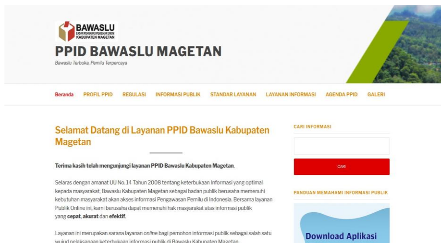
Gambar 7. Tampilan Website PPID Bawaslu Kab. Magetan