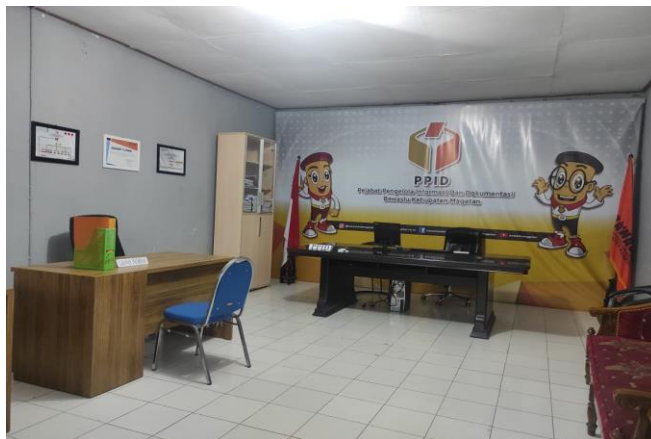
Gambar 3. Ruang Layanan PPID Bawaslu Kab. Magetan