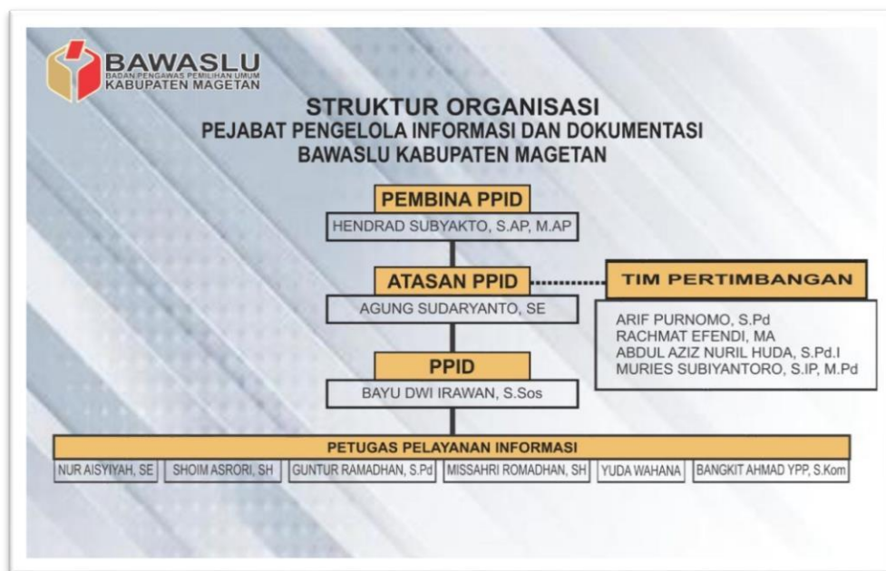
Gambar 1. Struktur Organisasi PPID Bawaslu Kab. Magetan

Struktur PPID Bawaslu Kabupaten Magetan ditetapkan berdasarkan surat keputusan Ketua Bawaslu Kabupaten Magetan nomor: 008.1/K.Jl-13/HM.00.02/05/2021 tentang pembentukan pejabat pengelola informasi dan dokumentasi Bawaslu Kabupaten Magetan