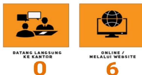
Gambar 6. Sarana Informasi Publik