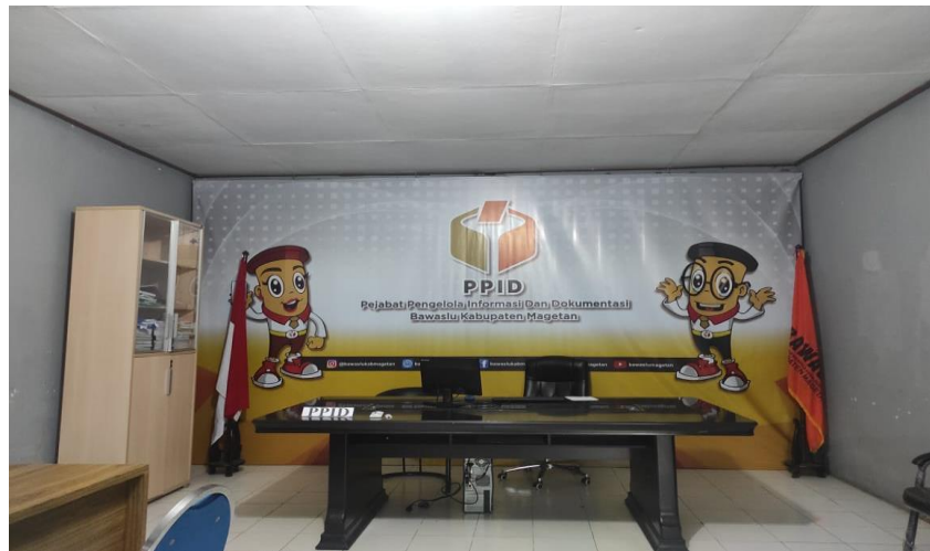
Gambar 4. Ruang Arsip PPID Bawaslu Kab. Magetan

Kabupaten Magetan mengajukan alokasi pemanfaatan ruangan Ruang tersebut dialokasikan sebagai ruang penyimpanan arsip-arsip PPID agar lebih tertata dan sesuai dengan kaidah kearsipan.